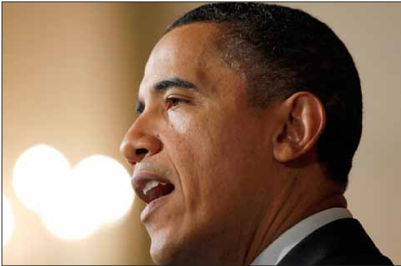
Estas sanciones se suman a otras adoptadas en los últimos meses por el Gobierno de Barack Obama para intentar detener el programa nuclear iraní, que para Estados Unidos y sus aliados en Occidente tiene fines militares.

WASHINGTON, 6 de febrero. — El presidente de Estados Unidos, Barack Obama, firmó una orden ejecutiva que bloquea todos los activos del Gobierno iraní, incluidos los del Banco Central de ese país, en territorio estadounidense, informó hoy la Casa Blanca.